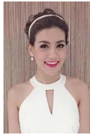
2. คิมเบอร์ลี