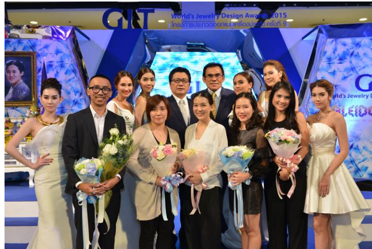
การแสดงผลงานของนักเรียนหลักสูตรออกแบบเครื่องประดับของ สถาบันวิจัยและพัฒนาอัญมณีและเครื่องประดับแห่งชาติ (องค์การมหาชน)