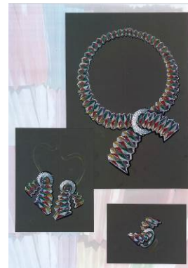
รางวัล Popular Design Award 2015