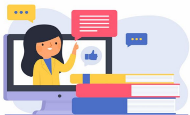
งานบริการฝึกอบรม