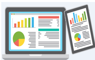
งานบริการข้อมูล